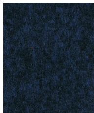
Navy Blue SJT03